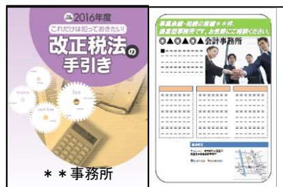
見本(表紙+最終面(広告活用イメージ))

A4・24P 本文2色、表紙4色、図や写真をふんだんに使った見やすい小冊子です。事務所の名前を表紙下段と裏表紙に挿入、全面広告も可能!!