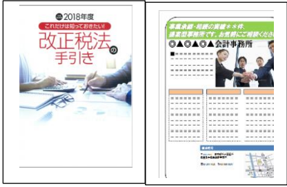
見本(表紙+最終面(広告活用イメージ)) ※広告制作費(18,000円~/税別)、印刷代(10,000円/税別)別途承ります。