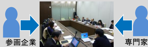
* 事例を通じた実務スキームの検討