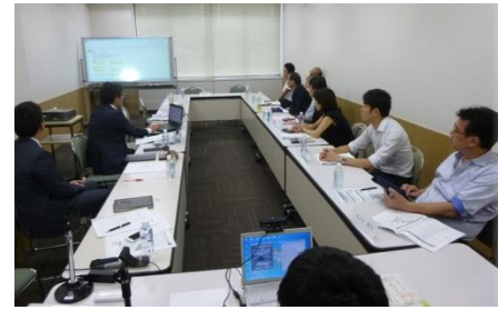
※第3回開催時、システム概要をデモする開発メンバーと参加者