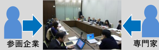
* 事例を通じた実務スキームの検討