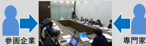
* 事例を通じた実務スキームの検討