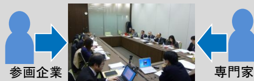
* 事例を通じた実務スキームの検討