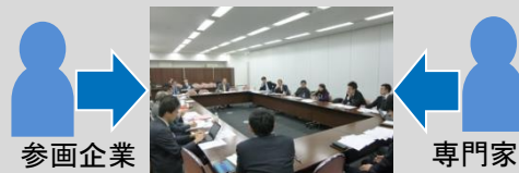
* 事例を通じた実務スキームの検討