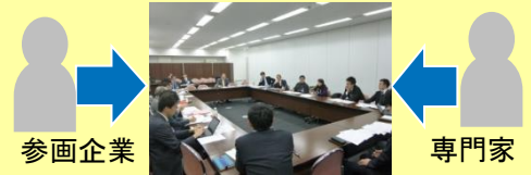
* 事例を通じた実務スキームの検討

※今回より、Jシェア(JPBM情報シェア7 クラウドサービス)参加が可能です。先着7カ所。ぜひお早めに！