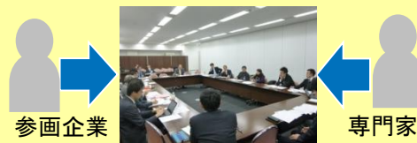
* 事例を通じた実務スキームの検討

※今回より、Jシェア( JPBMM情報シェア7 クラウドサービス )参加が可能です。先着9カ所。ぜひお早めに!