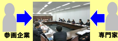
* 事例を通じた実務スキームの検討