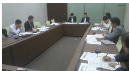
ノウハウ検討会のイメージ(※画像は前回会議)