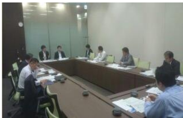
具体的事例に対して、積極的に質問を行う参加者