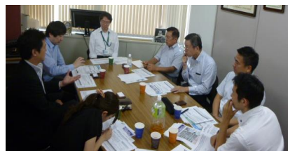
ノウハウ検討会のイメージ (※画像は前回会議)