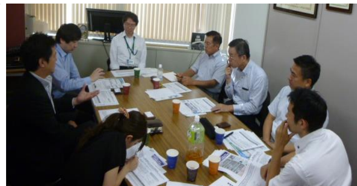
信託活用事例について情報共有を行う参加メンバー

スキーム開発は、ひまわり生命保険(株)の商品「連生終身保険」を、①富裕層の二次相続対策、②不動産オーナーの事業承継対策の具体的事案に当てはめたことで、商品性が生きた家族形態や資産状況などが確認できた。これにより今後のスキーム