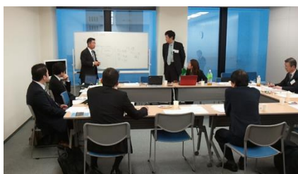
ノウハウ検討会のイメージ（※画像は第2回会議）