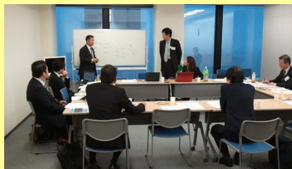
ノウハウ検討会のイメージ(※画像は第2回会議)