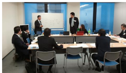
ノウハウ検討会のイメージ（※画像は第2回会議）