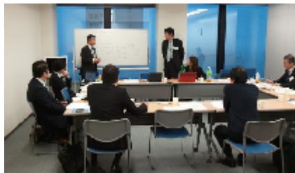
ノウハウ検討会のイメージ( 画像は第2回会議)