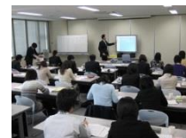
地域ドクター等へ向けた最新情報によるセミナーの開催