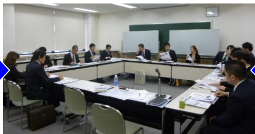
ノウハウ検討会のイメージ (※画像は第1回)